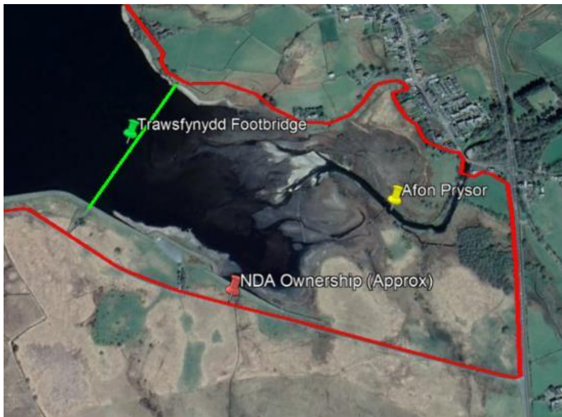
Ffigwr 1: Lleoliad Pont Droed Trawsfynydd

Fel y gwelir yn Ffigwr 1 , mae'r bont droed wedi'i leoli ym mhen deheuol Llyn Trawsfynydd, sydd o fewn tir eiddo'r NDA.